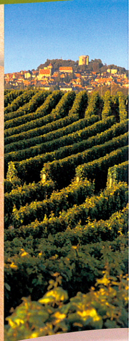
Sancerre et son vignoble